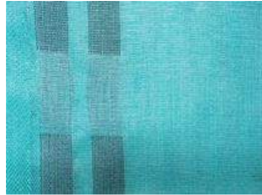
WIND BREAK NET