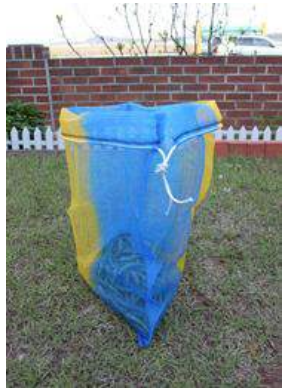
PEPPER HARVESTING MESH BAG