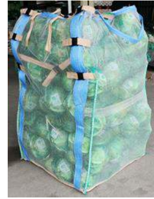
Mesh Jumbo Bag for cabbage