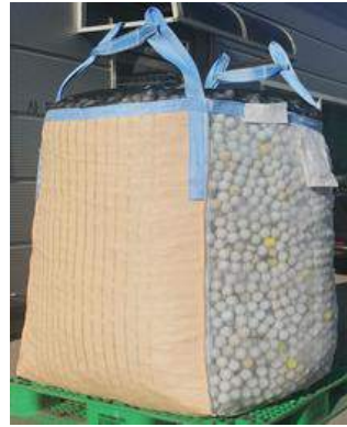
PPPE Jumbo bag