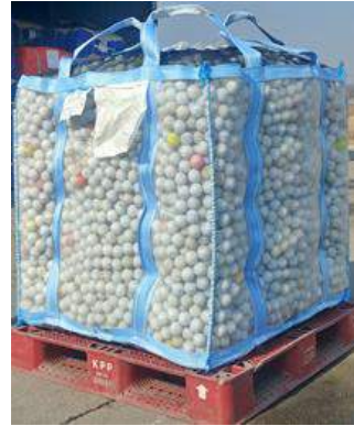
PE Jumbo bag ( Pipe)