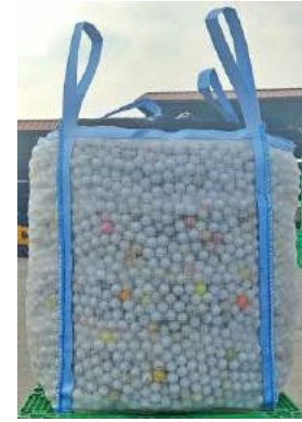
4 Side PE Mesh Jumbo Bag